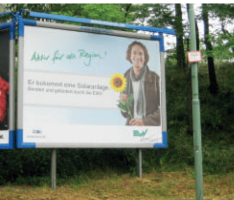
Wir lassen uns sehen – zum Beispiel mit einem Hinweis auf unser Programm zur Förderung erneuerbarer Energien.

Strom macht vieles erst möglich, sowohl zu Hause als auch in einem Unternehmen. Unsere leistungsstarke Technik und jahrzehntelange Erfahrung sorgen dafür, dass unsere Kunden rund um die Uhr optimal mit unserem regio strom oder regio strom-natur versorgt sind. Auf die Heizwärme regio wärme ist ebenso Verlass wie auf unser Trinkwasser. Dafür stehen wir.