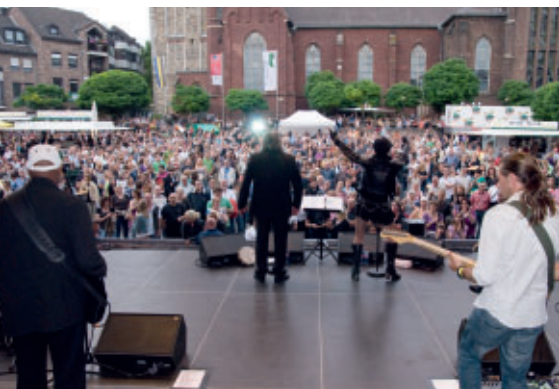
Das Eschweiler Music Festival, ein kultureller Höhepunkt – kostenlos für die Besucher, gesponsert von der EWV.